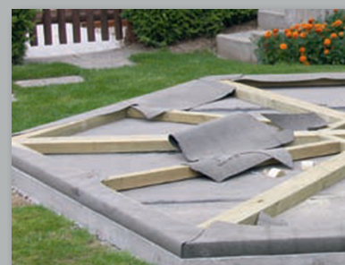
Isolierter Boden mit verschweisster Dampfsperre! Isolationsschüttung im Hohlraum des druckimprägnierten Bodenrostes. (Kein Ungeziefer im Haus und Holz ist vor Fäulnis von unten geschützt)