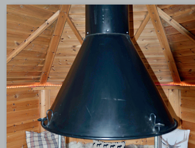
Freihängender Teleskop-Rauchfang Stufenlos verstellbar.