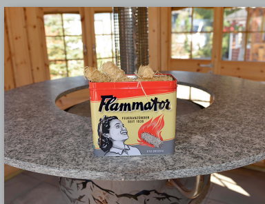
Flammator der Original Feueranzünder - Für Holzfeuerung, Cheminée, Grill - Keine Rückstände, Gifffreier Brand, keine Geschmacksrückstände