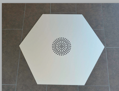
Funkenschutzblech 6-eckig unter Grillanlage

Lieferumfang gemäss Beschrieb im Prospekt. Mit der Lieferung Swiss Edition erhalten Sie folgendes Zubehör exklusiv: