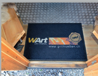
Schmutzschleuse beim Eingang (Schützt den Holzkieferboden vor Schmutz und Nässe)